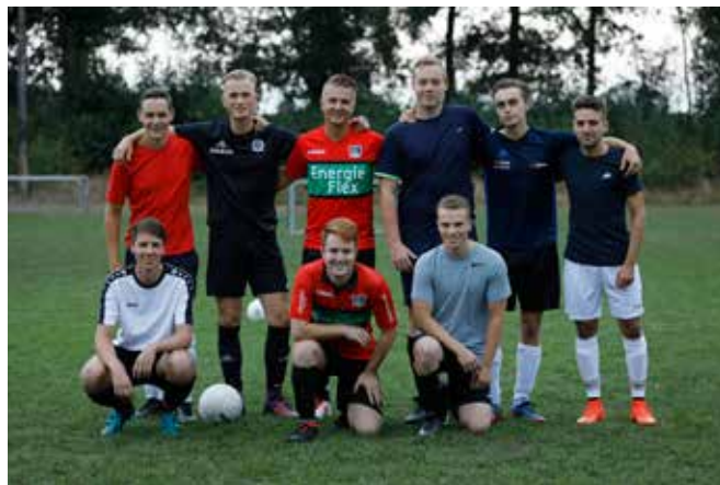
Foto: Een deel van het elftal bij de training

Een stukje geschiedenis werd geschreven op deze bewuste zondag 2 september 2018. Het eerste senioren-team EGS is gestart.