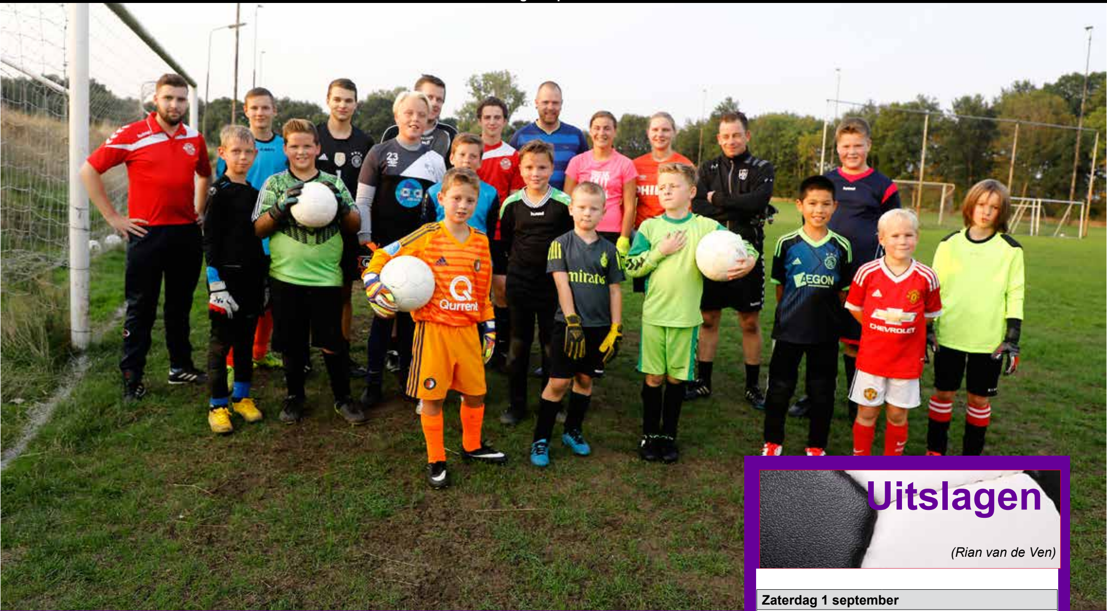
Foto: Ook de keepersschool is op de vaste dinsdagavond weer van start gegaan