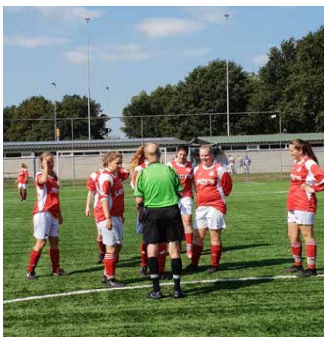
De wat oudere scheidsrechter in Veghel had zijn dag niet